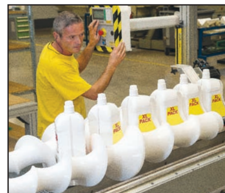
Contrôle et test en fonctionnement

Faber est leader dans la conception et la réalisation d'équipements pour machines d'embouteillage : vis, outillages, sellettes, pincés. La société propose aussi des manchons de retournement de 90° à 360°.